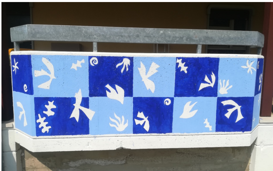
Al modo di Matisse