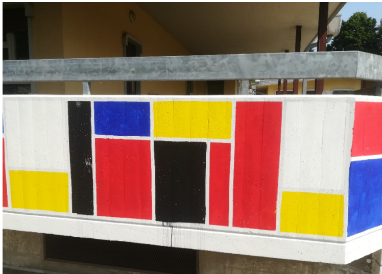
Ispirati a Mondrian